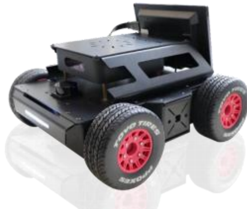
图 1 推荐平台样图

(3) CPU：采用 Intel 或者 Jetson Nano 主控，运用深度学习算法。