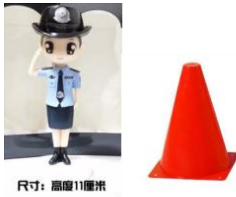
人偶及锥桶示意图

• 赛道中随机放置临时人偶(模拟行人)和红色锥桶(13.5cm*13.5cm*23cm 长宽高),位置由裁判赛前确定。