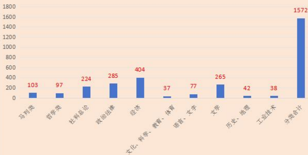
2026年1-3月图书借阅比例：前十类